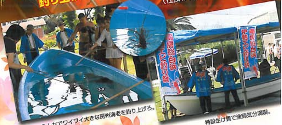
みんなでワイワイ大きな房州海老を釣り上げる。