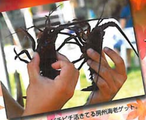
ピチピチ活きてる房州海老ゲット。